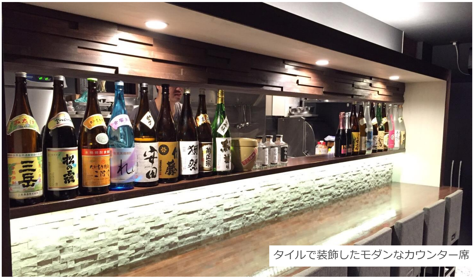
タイルで装飾したモダンなカウンター席